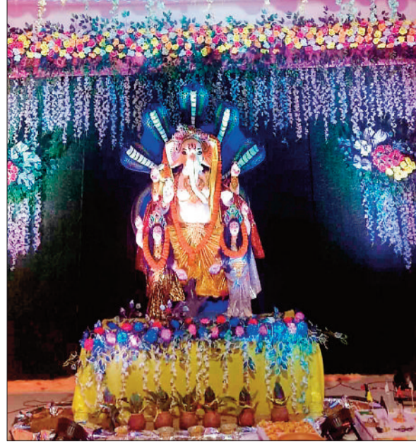
सार्वजनिक गणेश पूजन समिति बस स्टैंड सलका।