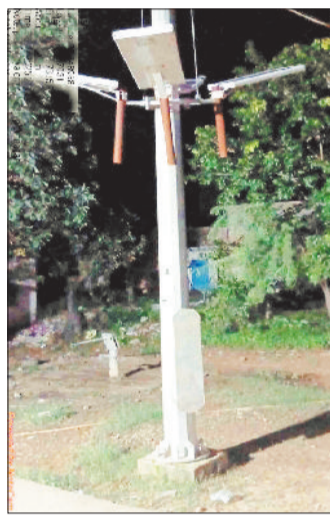
खराब पड़ा सोलर हाई मास्क लाइट।

विभाग को सूचना देने के बाद भी आज तक नहीं हुई मरम्मत