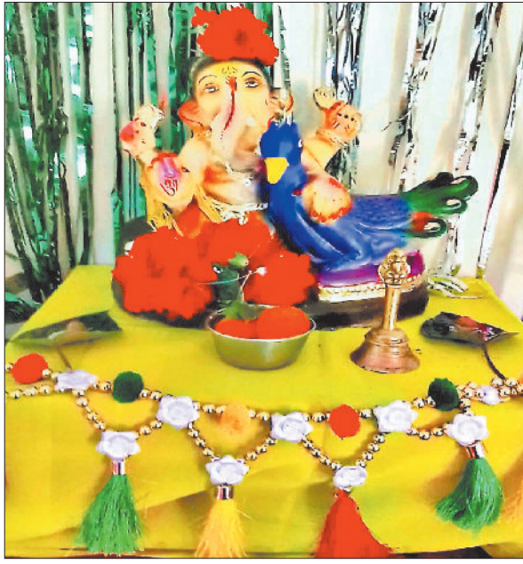
गोधनपुर में स्थापित गणेश प्रतिमा।