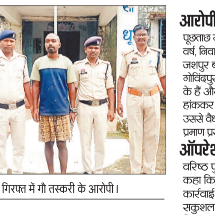
पुलिस गिरफ्त में गौ तस्करों की आरोपी।