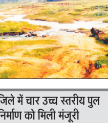
जिले में चार उच्च स्तरीय पुल निर्माण को मिली मंजूरी

जशपुरनगर। जिलेवासियों के लिए आवागमन को सुगम बनाने के लिए मुख्यमंत्री विष्णुदेव साय ने सडक और पुल-पुलिया का तेजी से विकास कर रहे हैं। जिले में पुल-पुलिया की कमी को दूर करने के लिए मुख्यमंत्री श्री साय ने चार वृहद पुल निर्माण के लिए 13 करोड़ 46 लाख रुपये की स्वीकृति दी है। इनमें गुलहरिया बहनी मार्ग पर श्री नदी पर उच्च स्तरीय पुल एवं पहुंच मार्ग निर्माण शामिल है। पुलविहिण इस नदी पर पुल निर्माण करने का मांग ग्रामीणों द्वारा लंबे समय से किया जा रहा था। बरसात के दिनों में इस नदी को पार करने में ग्रामीणों को परेशानी का सामना करना पड़ता था। इस समस्या को दूर करने के अलावा सीएस श्री साय ने जिले में 1.71 करोड़ की लागत से बेनसारी नाला में किराकिला से केराकखार रोड में पुल पुलिया का निर्माण, मैना नदी में कांसाबेल से शब्दमुंडा मार्ग में जजर पुलिया के जगह नए पुल निर्माण के 3.49 करोड़ की लागत से निर्माण किया जा रहा है।