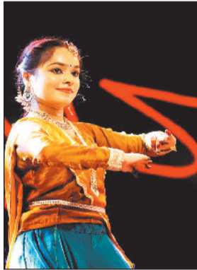
हरिभूमि न्यूज ►► रायगढ़