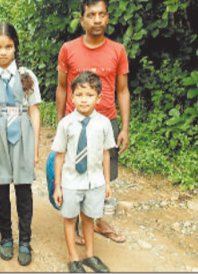
बह रहा था। जिसके कारण कोतबा की ओर से भालुखार स्थित शासकीय प्राथमिक शाला के शिक्षक व बच्चे वहाँ नहीं पहुंच सके। स्कूल आज नहीं खोला जा सका। कुछ प्राइवेट स्कूलों के बच्चे शेष पेज 4 पर

स्वास्थ्य सुविधाओं व दैनिक दिनचर्या के वस्तुओं के लिये लोगों जहदोजद का सामना करना पड़ रहा है। निजी स्कूलों के बच्चों को पुलिस की सहायता से घर पहुंचाया गया। मंगलवार, बुधवार व गुरुवार को रुक रुक कर हो रही बारिश में भैरवी नदी का जलस्तर एकाएक बढ़ गया। गुरुवार की सुबह पुल के ऊपर से दो फीट ऊपर पानी