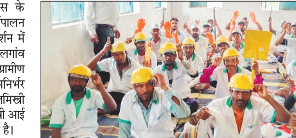
प्रशिक्षण प्राप्त करते राजमिस्त्री।