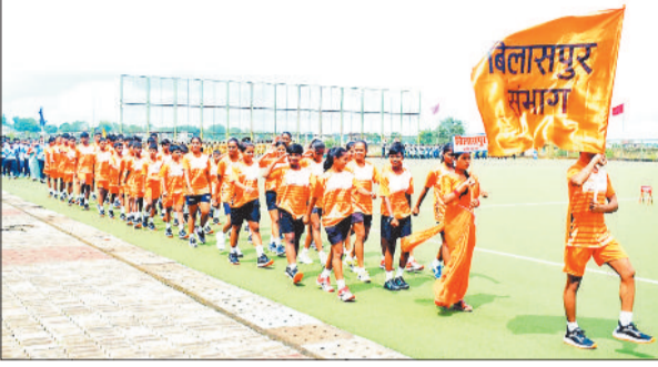
मार्च पास्ट करते खिलाड़ी।