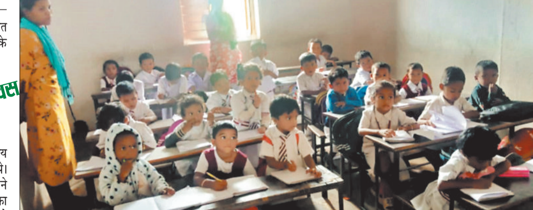
शिक्षक के साथ कक्षा में उपस्थित बच्चे।