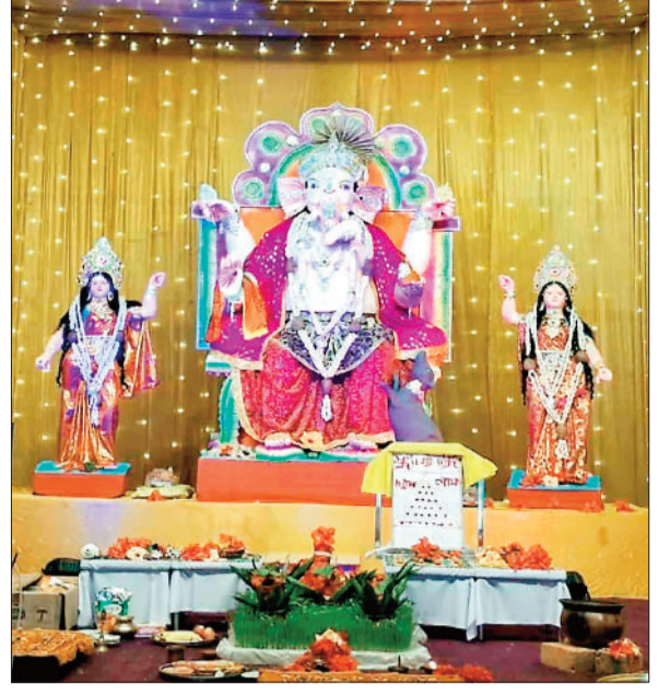
सार्वजनिक श्री गणेश पूजा समिति भैयाथान रोड सूरजपुर।