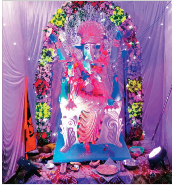
श्री हनुमान मंदिर गणेश पूजा समिति रामानुजगंज।